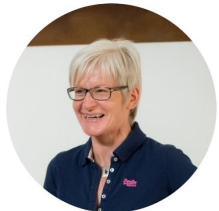
lic. oec. publ. et MBA Dipl. Mental-Coach, Coach Matrix Inform

In meiner jahrelangen Tätigkeit als Führungskraft, Coach und Trainerin lebe ich meine Leidenschaft, Menschen auf ihrem Lebensweg zu begleiten schon seit über 2 Jahrzehnten. Die Auseinandersetzung mit mir selbst, die Bereitschaft, hinzuschauen und der Mut, mich meinen eigenen Barrieren zu stellen, sind meine ständigen Begleiter und erlauben mir, Schritt für Schritt zu wachsen. Die Reise zu uns selbst ist die spannendste und dankbarste, die wir alle beschreiten dürfen. Sie entfesselt die unglaubliche Kraft, Energie und die Lebensfreude, die in uns allen steckt.